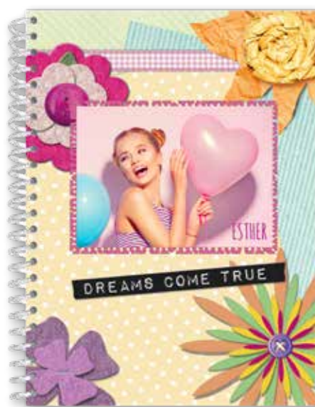
Libreta A5 15,5 × 21 cm