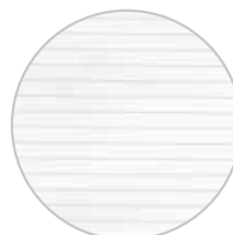
Hojas con líneas