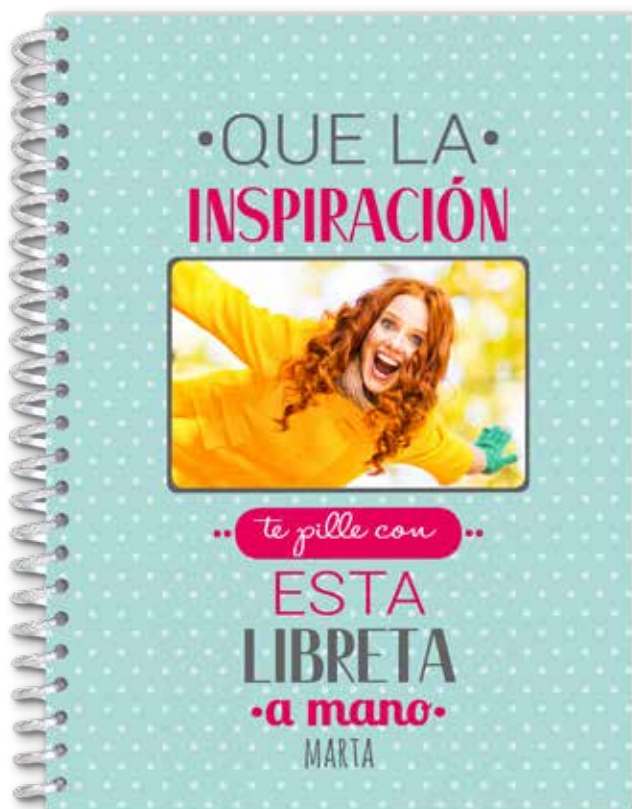
Libreta A4 21 × 29,7 cm